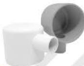
Elbow Cap (D)