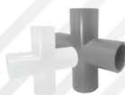
Tee 4 Way (AW)