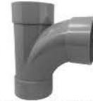
Large Radius Tee (D-LT)