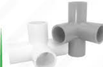
Tee 4 Way 90° (AW)