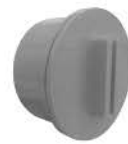
Clean Out (D)