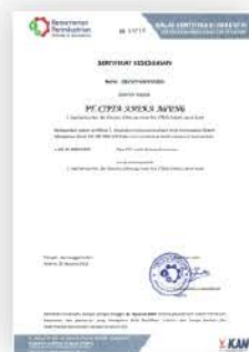
Sertifikat SNI 06-0084-2002