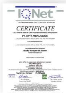
Sertifikat ISO 9001 : 2015