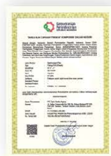
Sertifikat TKDN PIPA PVC