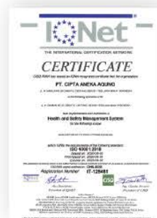
Sertifikat ISO 45001 : 2018